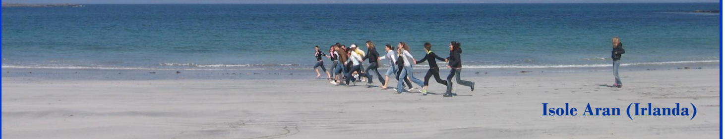
Isole Aran (Irlanda)

Il nostro Liceo, durante l'anno scolastico, organizza stages linguistici all'estero di una settimana che costituiscono per gli studenti un'ottima opportunità per potenziare la dimensione europea all'interno del proprio iter scolastico. Si tratta di un'esperienza di 'full immersion' stimolante e formativa, che va ad arricchire ed integrare il programma di studi.