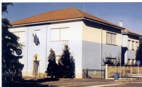
LICEO D'ARCONATE E D'EUROPA